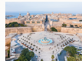
La Valletta, vista dall'alto della piazza centrale

La Valletta è l'attuale capitale di Malta, fu fondata nel 1566 dai Cavalieri Ospitalieri, che le diedero il nome del loro gran maestro Jean de la Valette. La Valletta è un importante centro culturale e turistico, ricco di storia riunisce più di 300 monumenti; al riguardo sono innumerevoli le attrazioni da visitare, basti pensare infatti che nel 2018, è stata designata anche come Capitale europea della cultura.