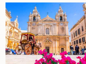
Mdina, ingresso nella città

Mdina è l'antica capitale di Malta. Conosciuta anche come la "Città silenziosa". Di origine medievale, conserva ancora un aspetto monumentale, l'interno è stato arricchito dai meravigliosi palazzi delle maggiori famiglie nobiliari maltesi. Mdina, ricca di storia e cultura è stata abitata prima del 4000 a.c, ma le sue fortificazioni attuali risalgono all'epoca araba 870 d.c. I residenti al suo interno sono circa 400.