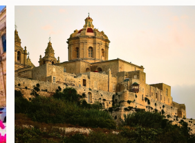
Mdina, la "fortezza" vista dall'esterno