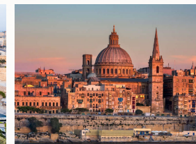
La Valletta, visuale periferica della cattedrale